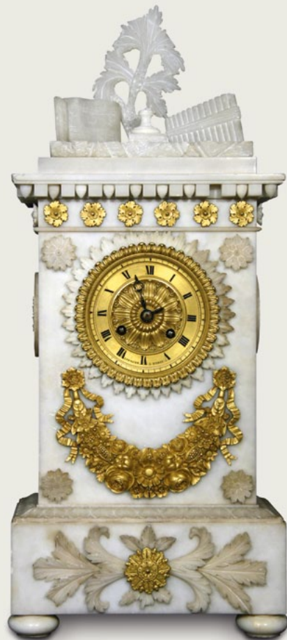
Biedermeier-Tischuhr mit Alabastergehäuse und Metallapplikationen vor und nach der Restaurierung