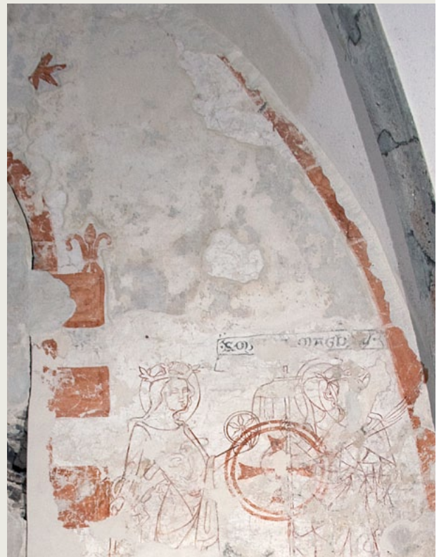
Ehemaliger Chorturm der ev. Pfarrkirche, Ober-Ohmen: Ausschnitt der Südwand vor und nach der Restaurierung unter Einbeziehung aufliegender jüngerer Putzschichten