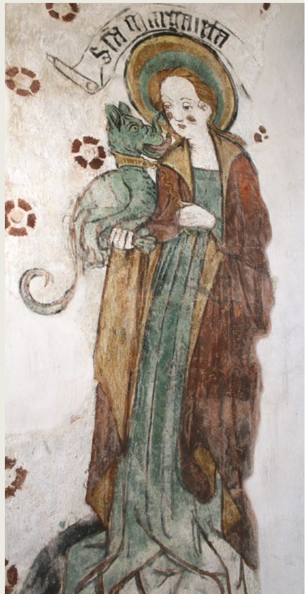
Michaeliskirche, Klein Karben: Darstellung der Heiligen Margareta vor und nach der Restaurierung